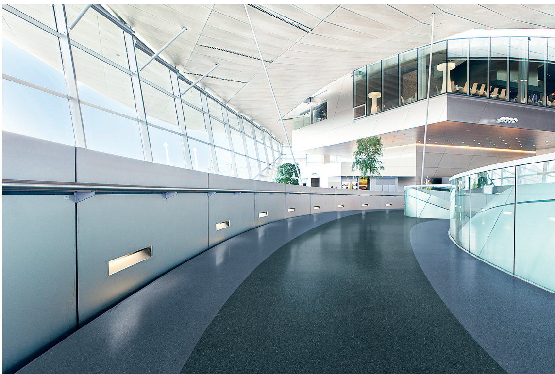
Upofloor er en av Ehrenborgs bestselgere i Norge.