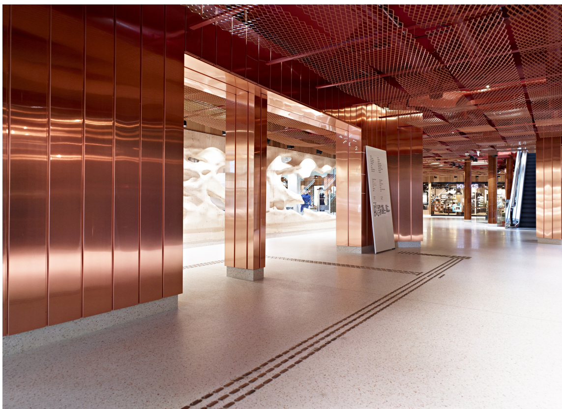
Senteret har en fin balansegang mellom eksklusivitet og tilgjengelighet.