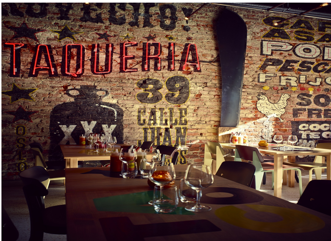
Sted for matopplevelser.