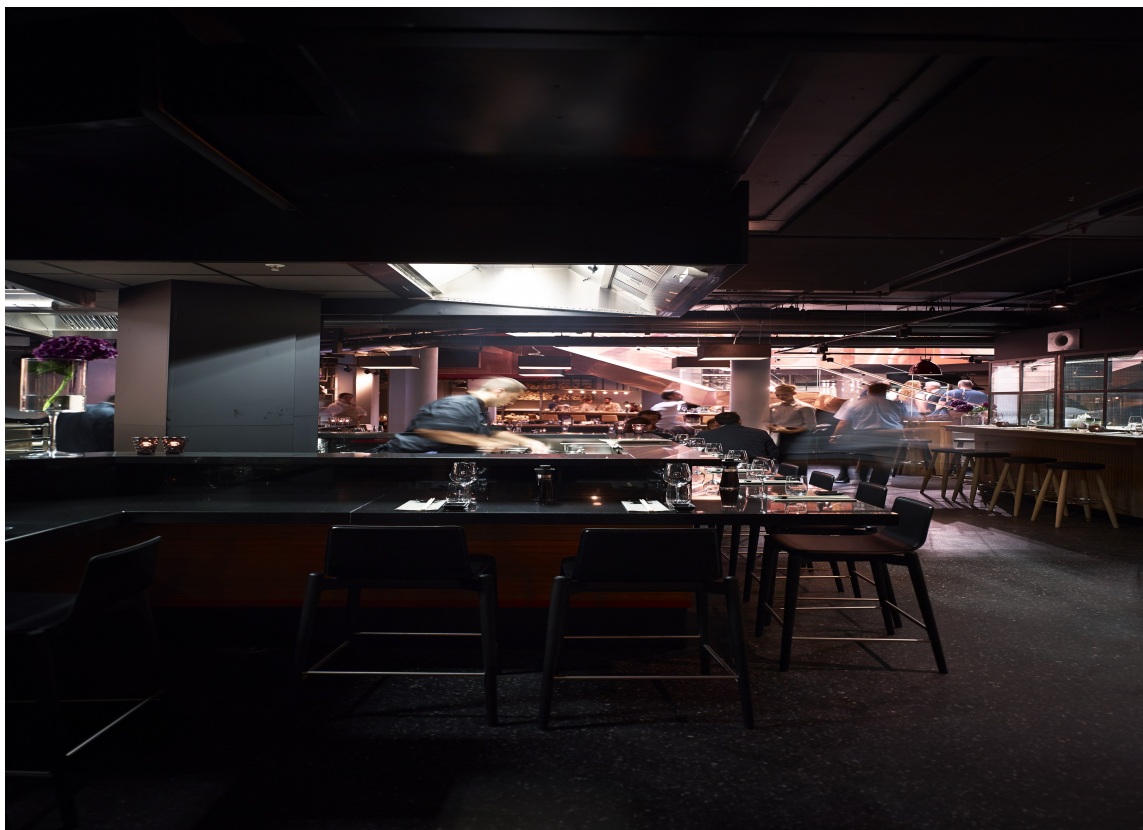
Hele underetasjen er forbeholdt servering.