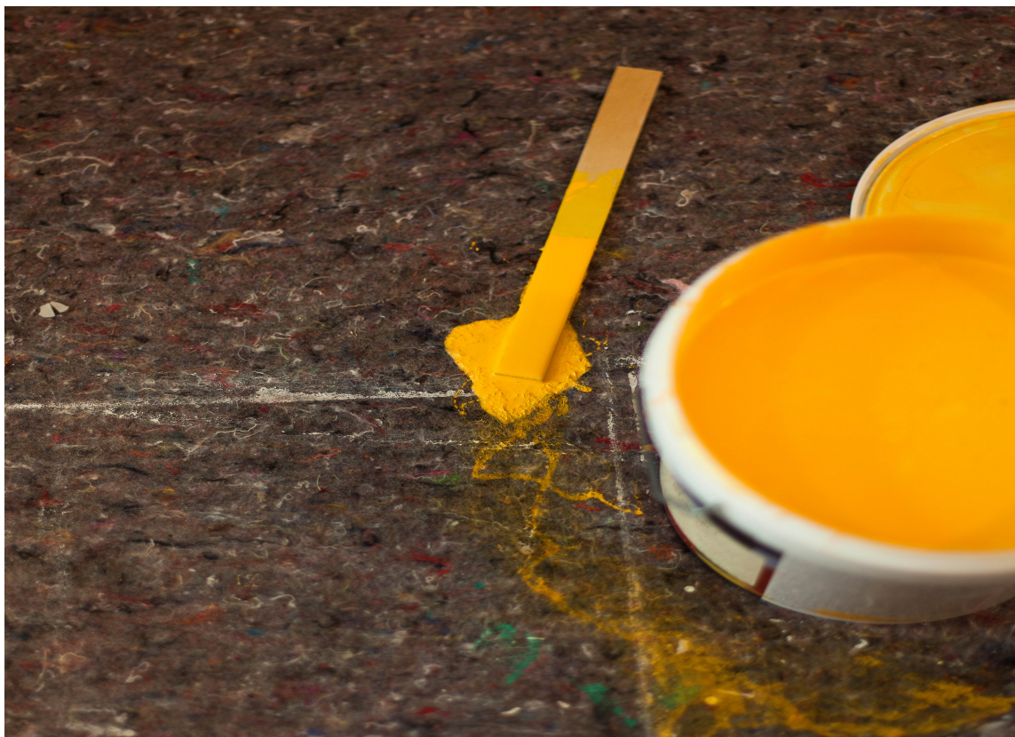
MALEFILT absorberer søl, og kan brukes igjen og igjen.. og igjen.