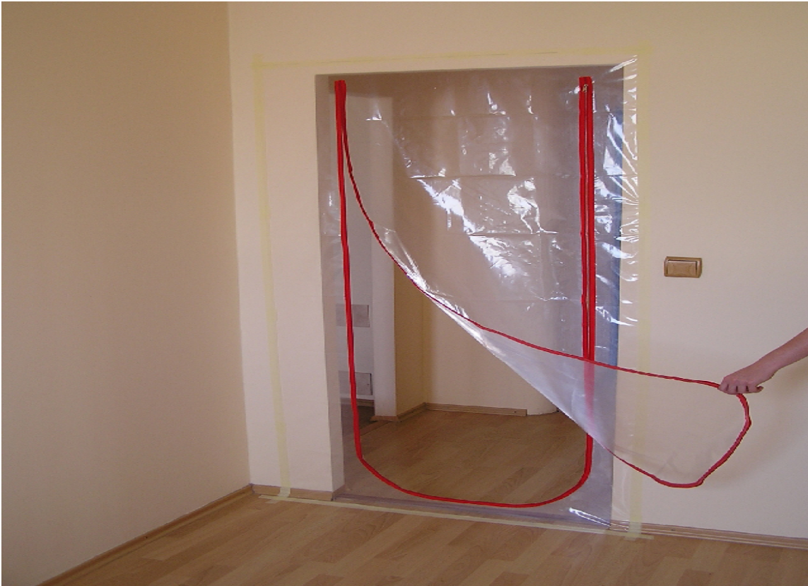
DØR MED GLIDELÅS: Med plastdører kan du begrense støvet til rommet du holder på i.