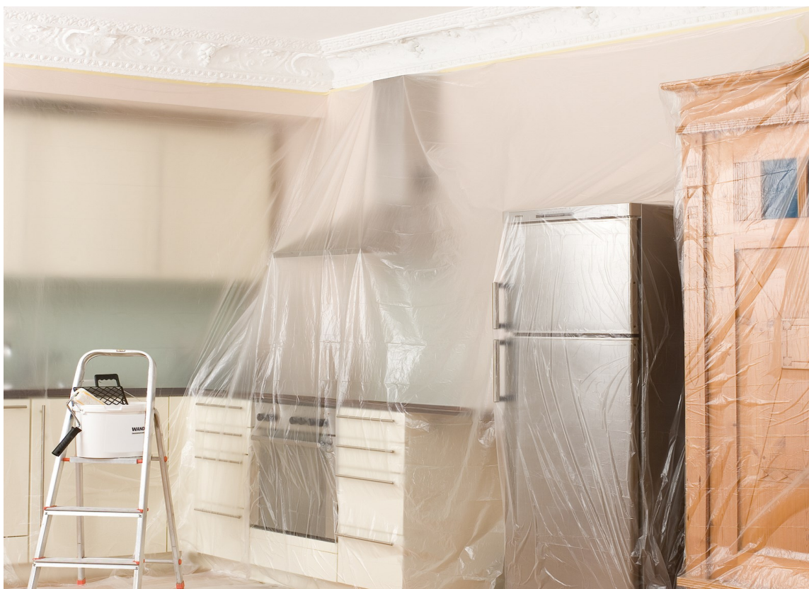
ELEKTROSTATISK DEKKEPLAST: Plast er utmerket til å dekke til kjøkken og møbler.