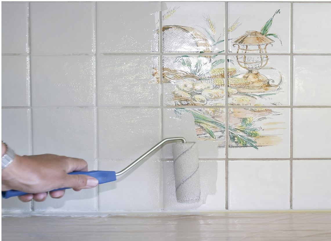
RUTER: Ved maling får fugene den samme fargen som flisene, og resultatet blir rutete.

Det er også mulig å skrape vekk den gamle fugemassen med et spesialverktøy, og legge på ny fugemasse i en farge som står til malingen. Dette gjøres før malingen påføres, og fugene må maskeres.