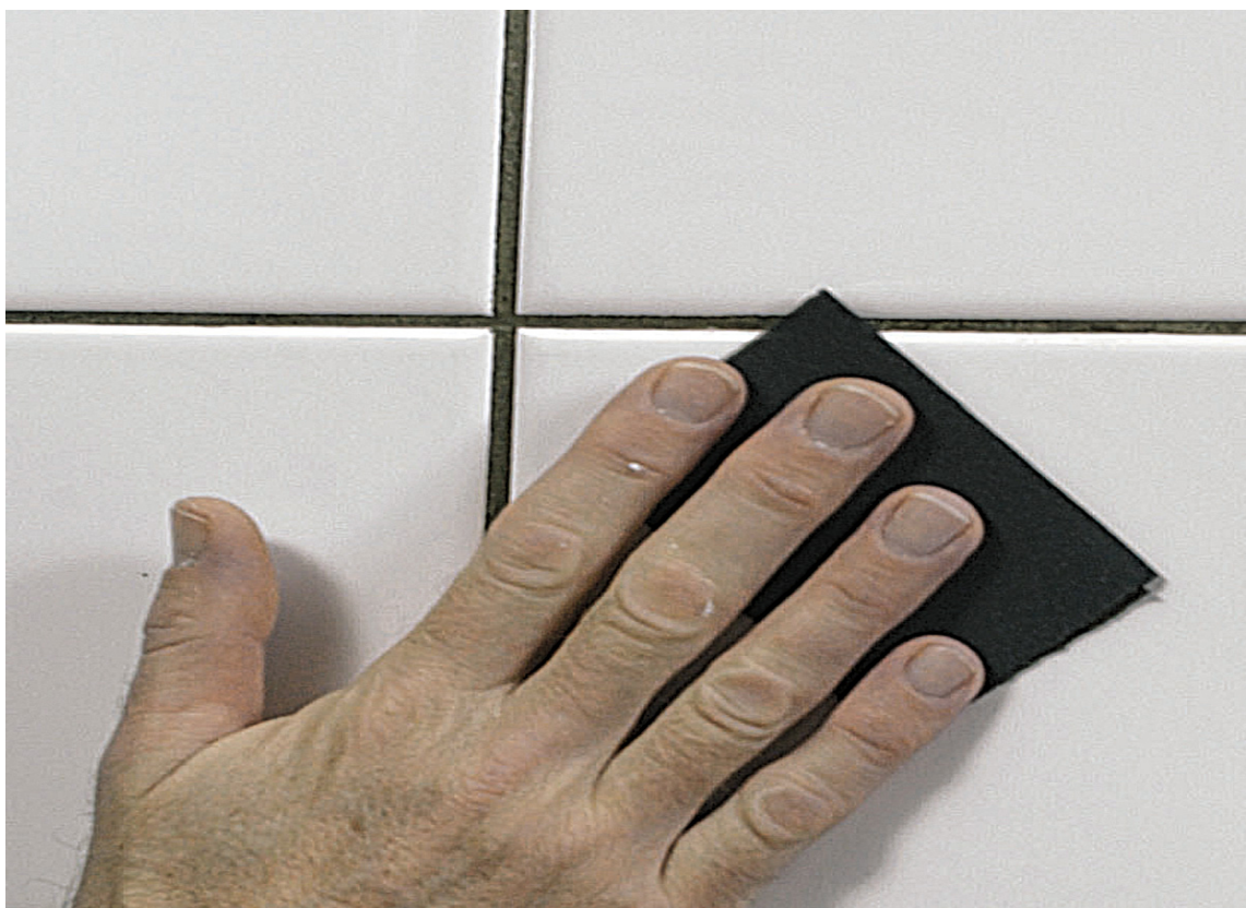
VEDHEFT: Den blanke overflaten mattes ned.