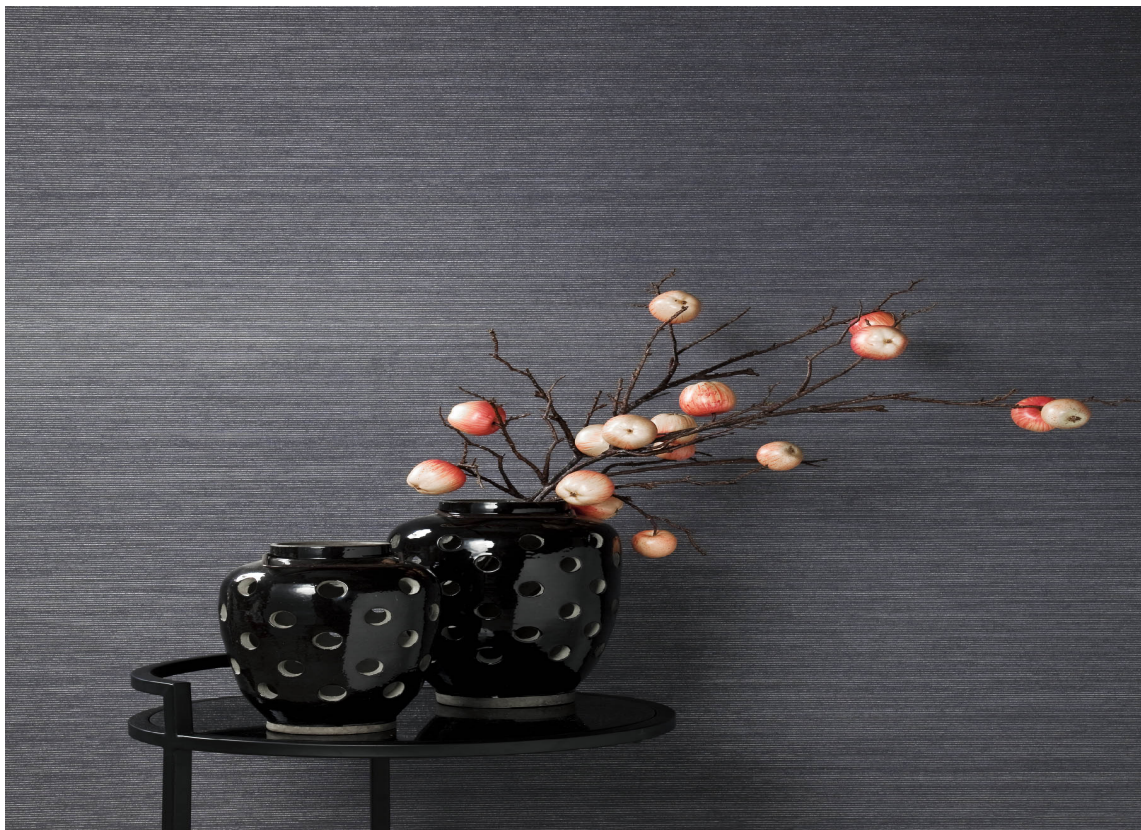
Tekstiltapet skaper en egen lunhet.

Lunhet, fargespill og eleganse er tre nøkkelord for å beskrive hva et tekstiltapet gir rommet. De mange forskjellige kvalitetene og tekstile materialene dekker manges behov – fra det klassiske ornamentale, til nøytrale og moderne design.