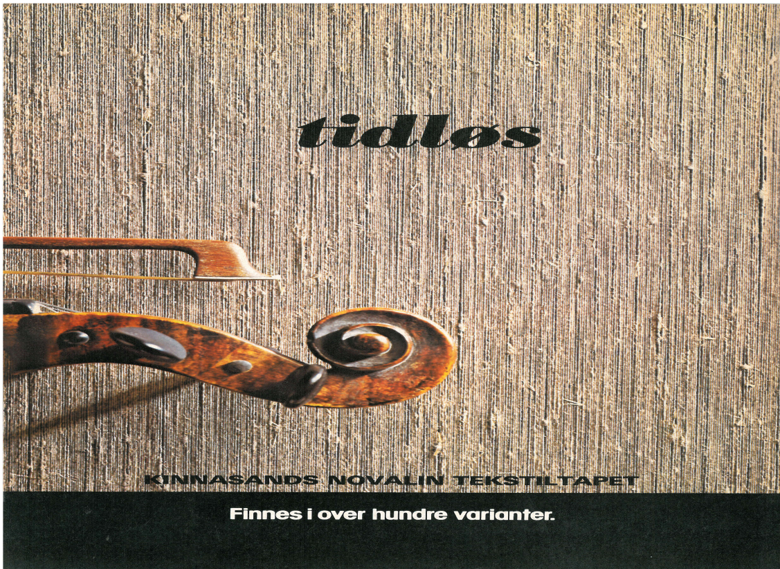
Ser tapetet kjent ut? Faksimile av annonse i "Vi fornyer oss" i 1981.