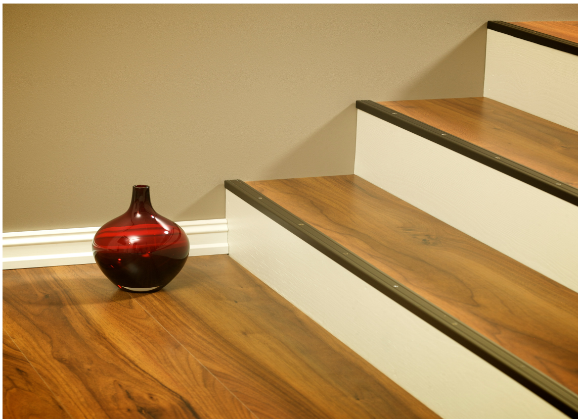
Trappenese er en list som settes på kanten av trinnet.