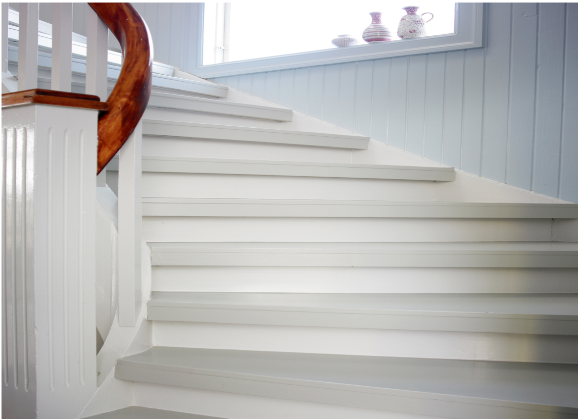
Trinnene har en mørkere nyanse enn opptrinnet.