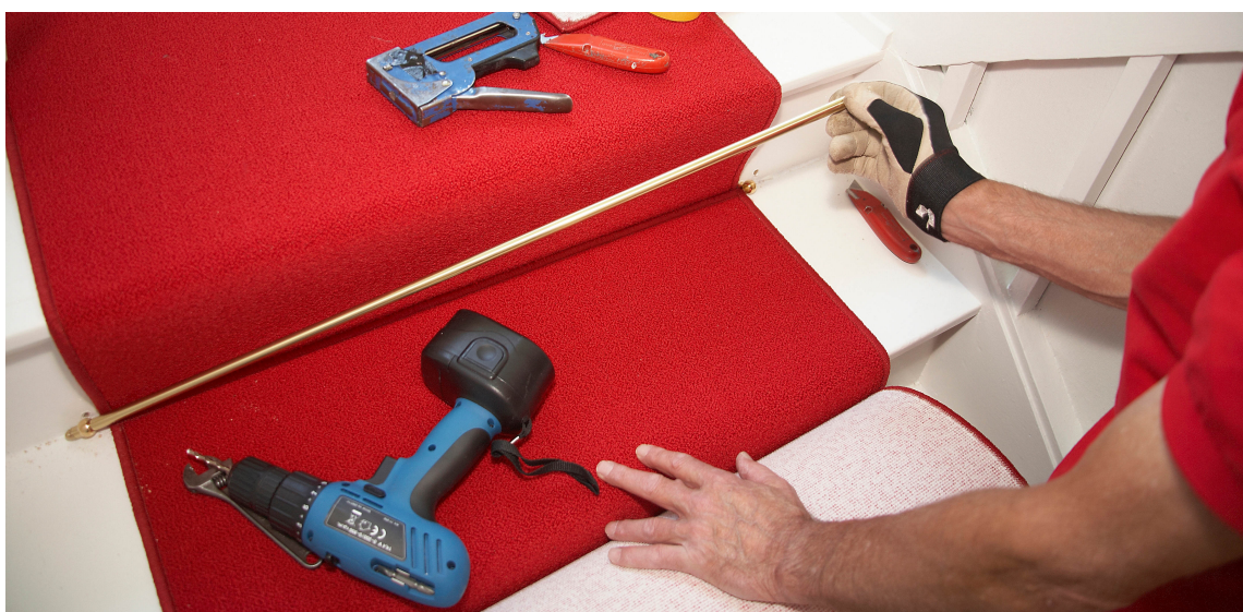
Teppeløper i trappen er en god løsning.

Skal man ha teppe i trappen, har man tre alternativer: halvmånetrinn, løper og heldekkende teppe. Halvmånetrinn er løse teppedeler, formet som halvmåner, som klistres direkte på trinnet. En løper festet med stenger (og eventuelt lim) trenger ikke dekke hele trinnet, og man vil kunne se den opprinnelige trappen på sidene. Heldekkende teppe innebærer at hele trappen eller hele inntrinnene dekkes med teppe, og er en stabil og god løsning som kan benyttes både på rette trapper og svingtrapper.