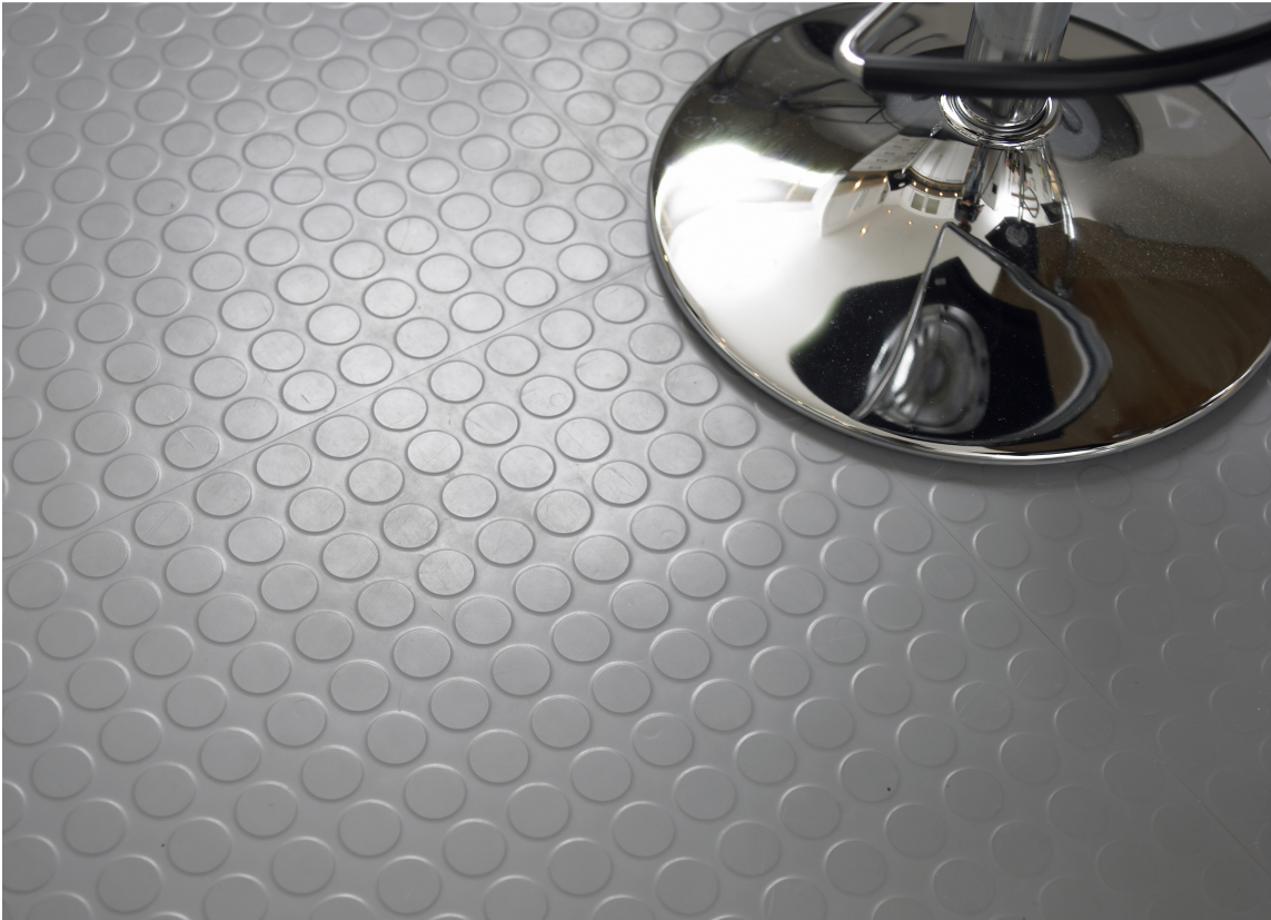
Gummigulv er praktisk i gang. Dette er fra Polyflor.