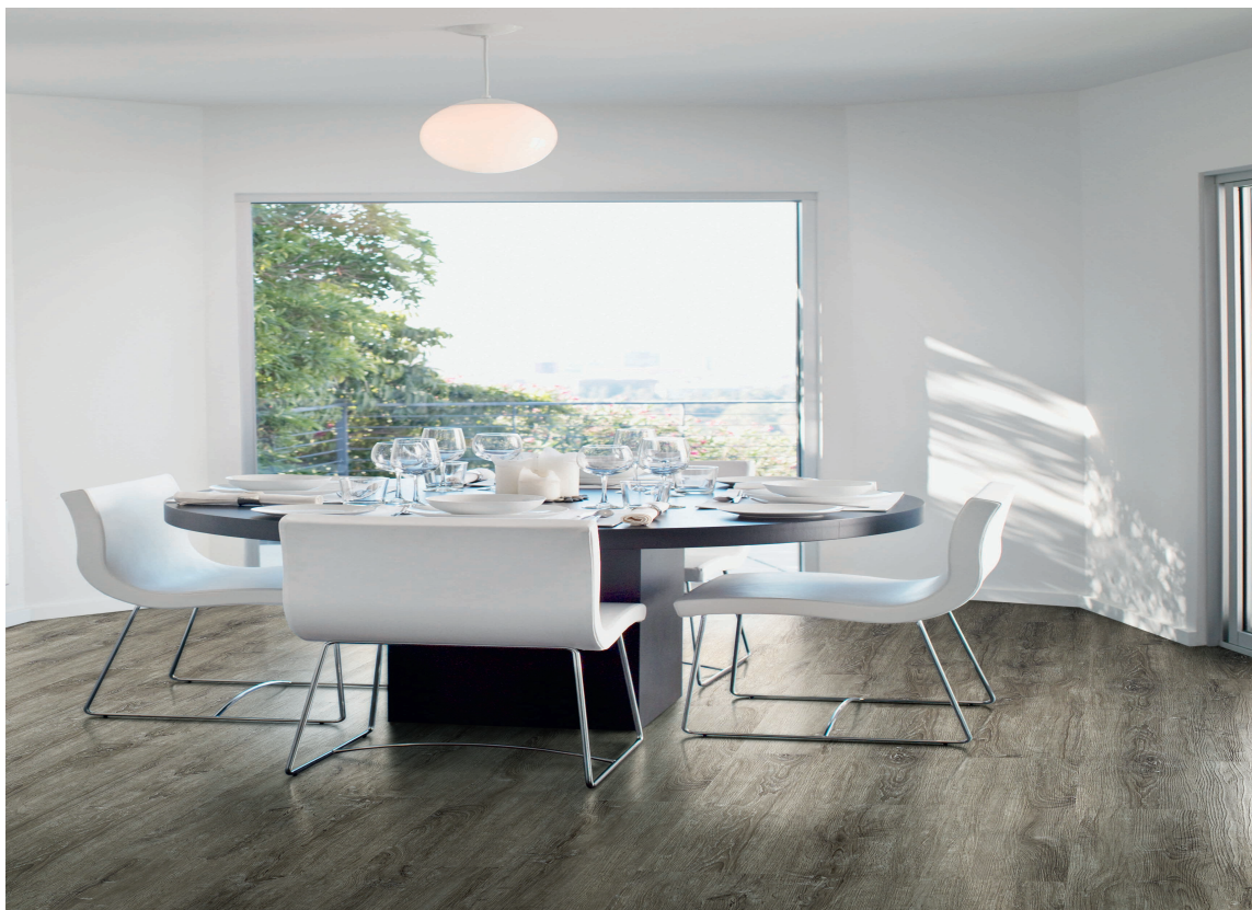
Kork kan være et godt valg på kjøkkenet. Dette er fra Golvabia.

Gode gulv: Parkett*, tregulv*, laminat, vinyl, linoleum, kork, gummi, fliser og naturstein