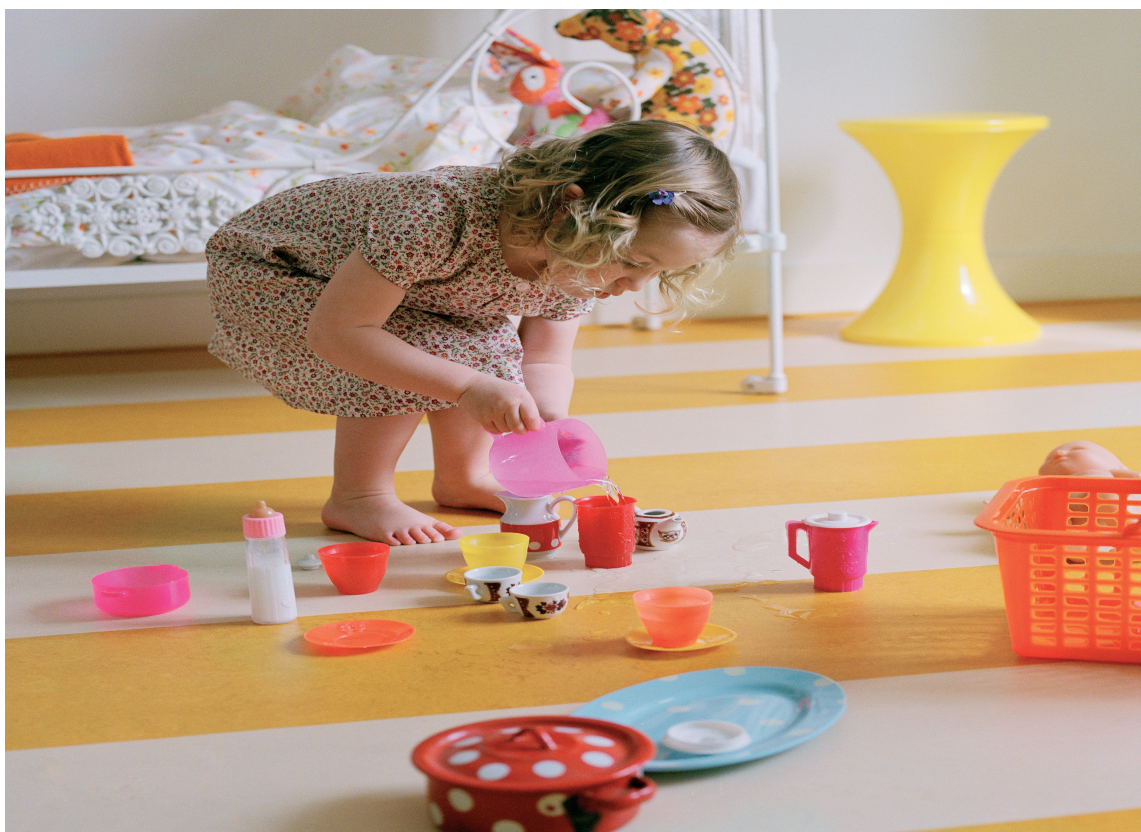
Linoleum er godt egnet på barnerom.