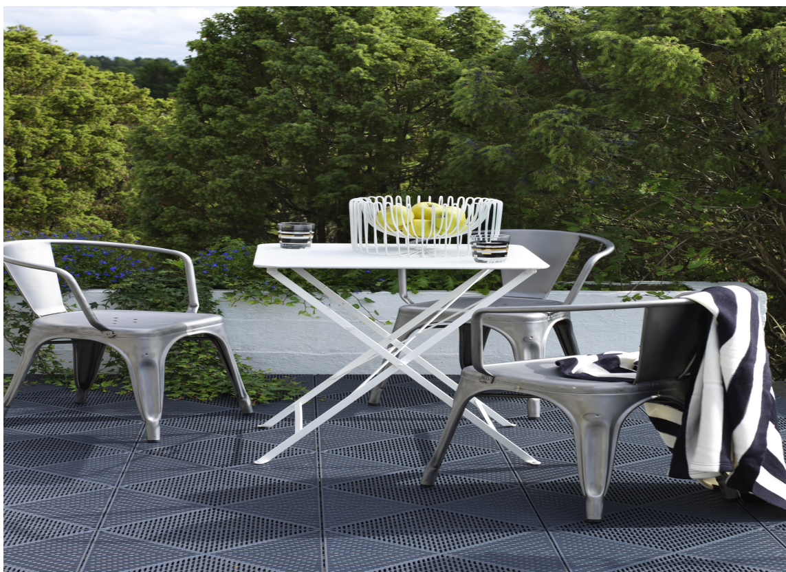
Plastplater som Bergoplattan fra Storeys er kjekke på balkongen.

* Med forbehold for riktig valg av overflatebehandling, type materiale og bruk av tilbehør som f.eks. avskrapingsmatter, avdemping, varmekabler etc.