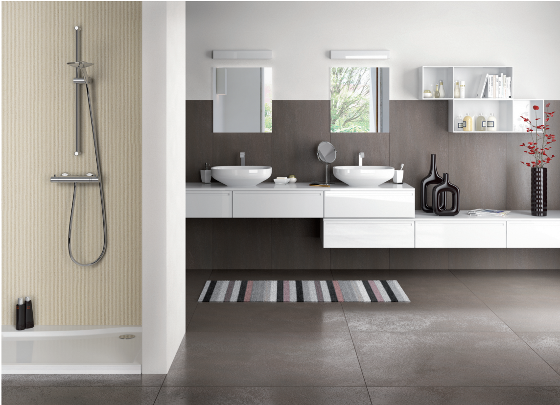
Fliser er godt egnet på bad. Disse er fra Höganäs.