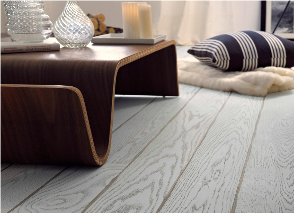
Parkett er egnet i stue. Dette er fra Tarkett.