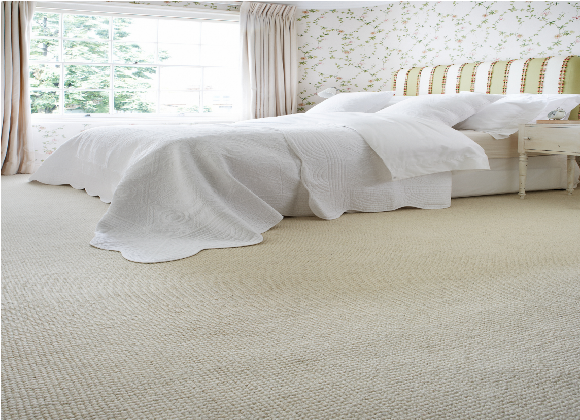
Teppe på soverom er behagelig. Dette er fra Intag.