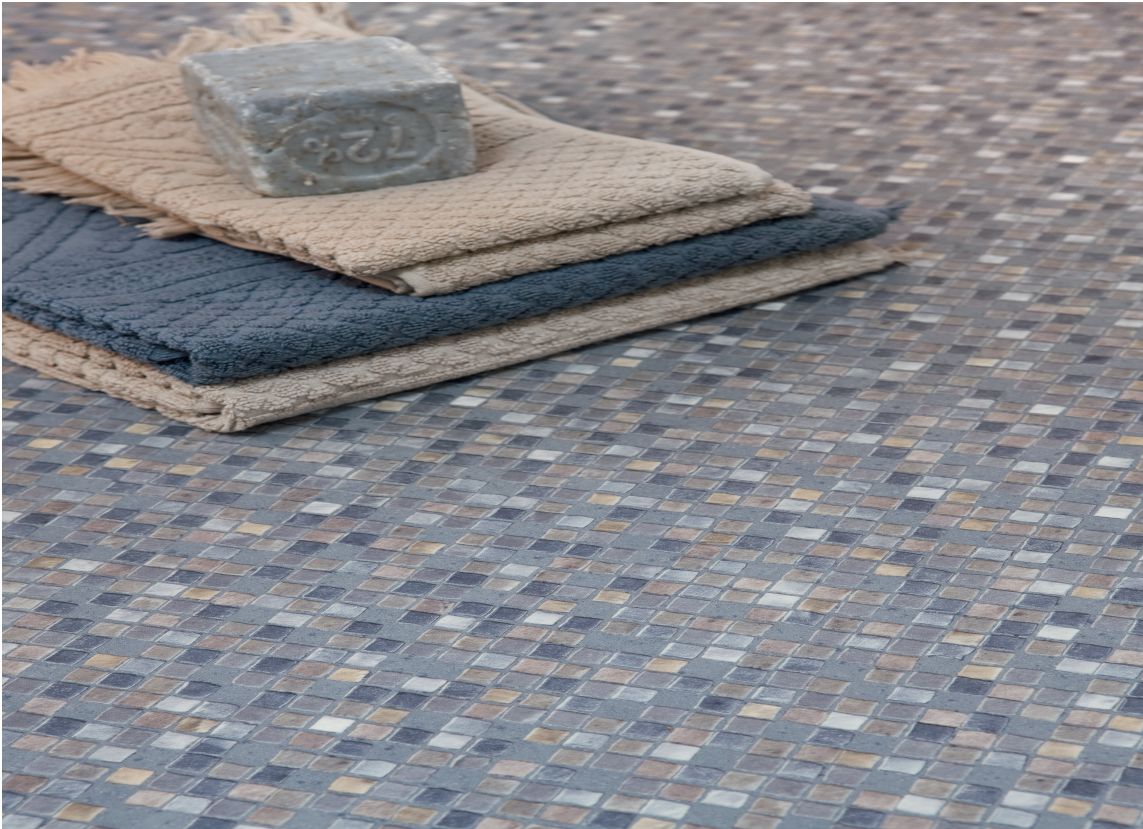
Vinylgulv kan være godt egnet i bod. Dette er fra Gerflor.