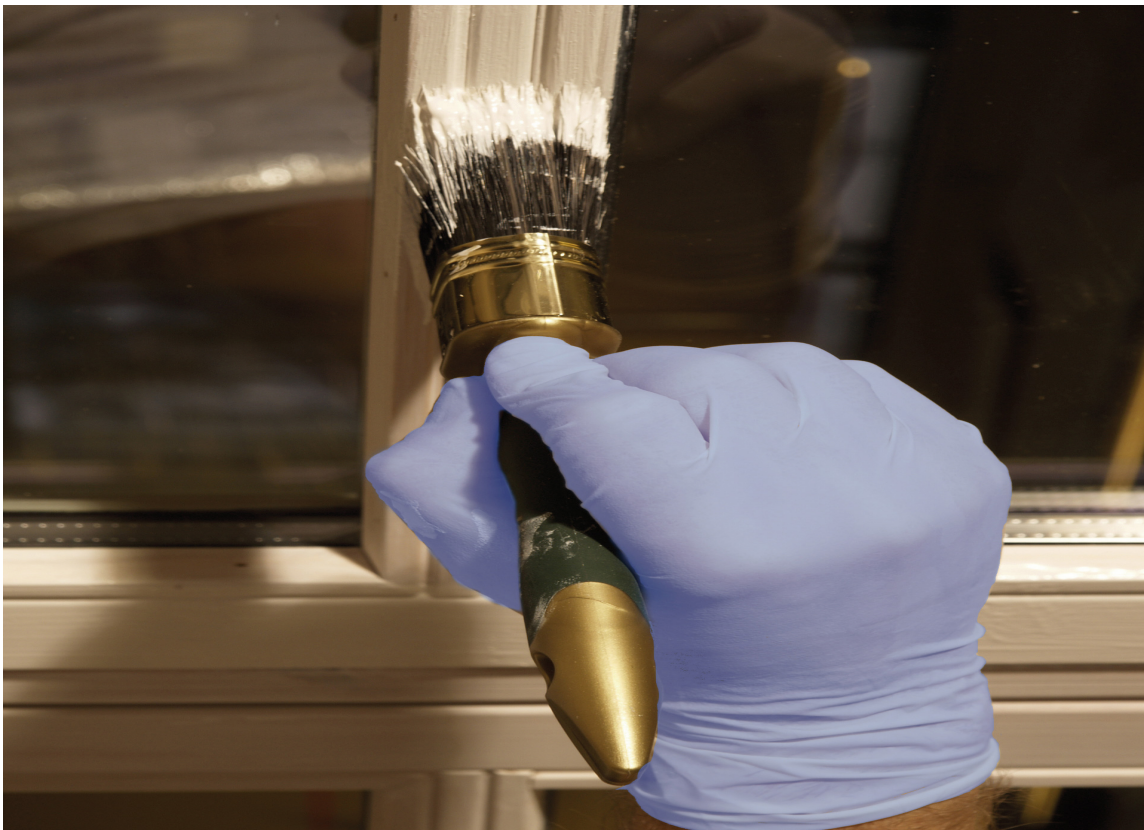
ENGANGSHANDSKER gjør at du ikke får malingsøl på fingrene.