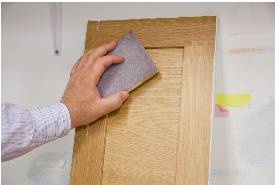
SLIPESVAMP: Mattsliping, sparkesliping og andre pusseoppgaver går lett med en slipepad.