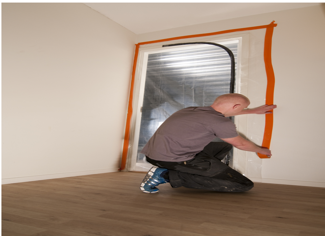
STØVBESKYTTER: En plastdør med glidelås gjør at du kan stenge støvet ute, og samtidig ha hele huset tilgjengelig.