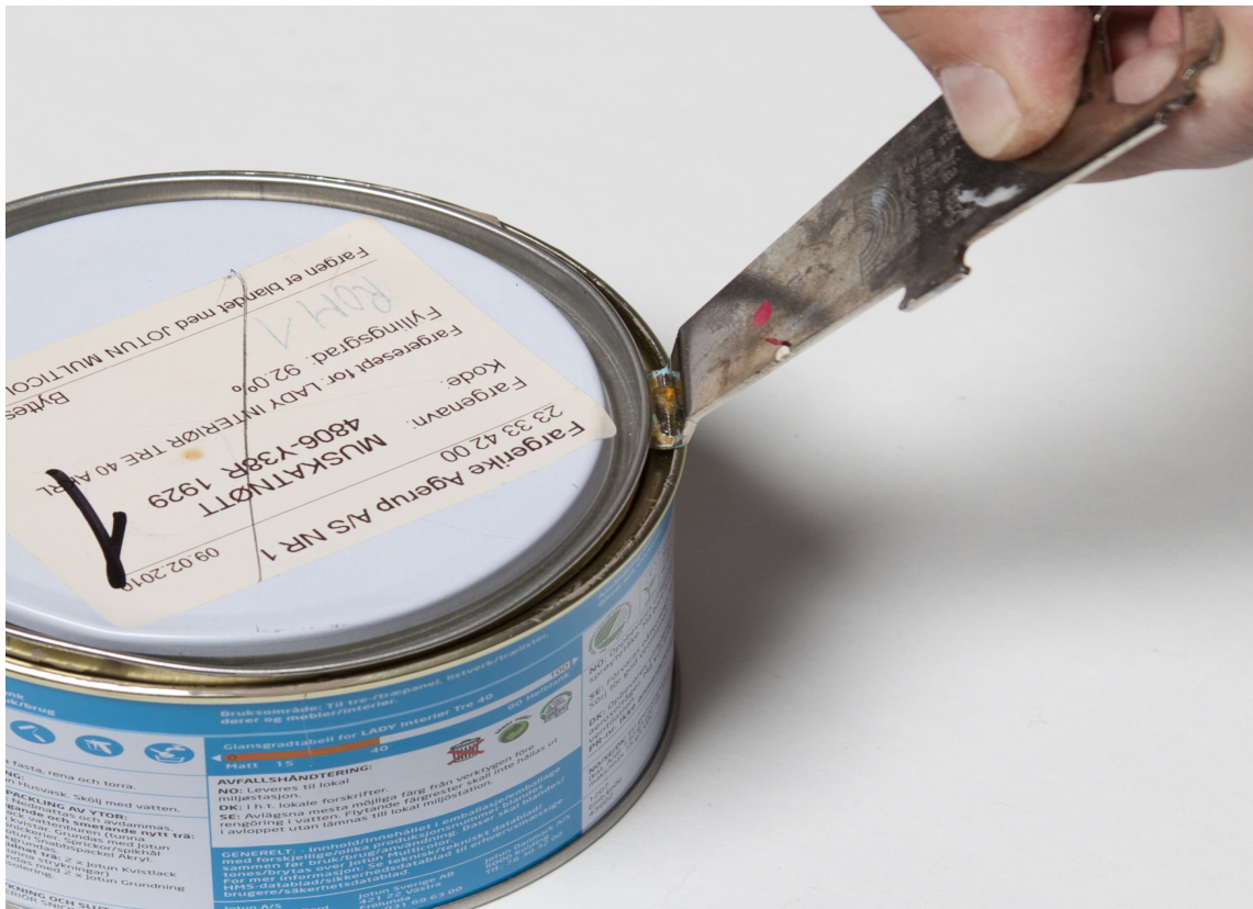
BOKSÅPNER: Unngå ødelagte kanter på metallemballasjen.