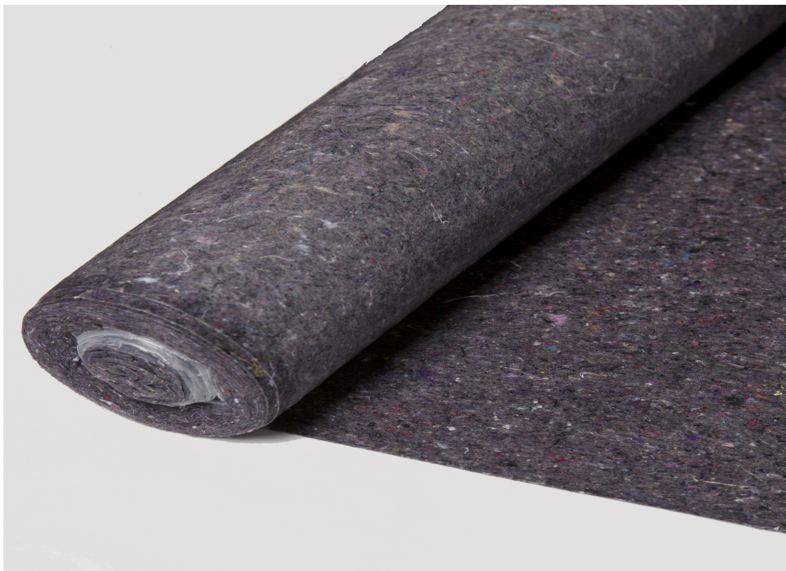
DEKKEFILT: Fleece-filt med plastbakside beskytter gulvet.