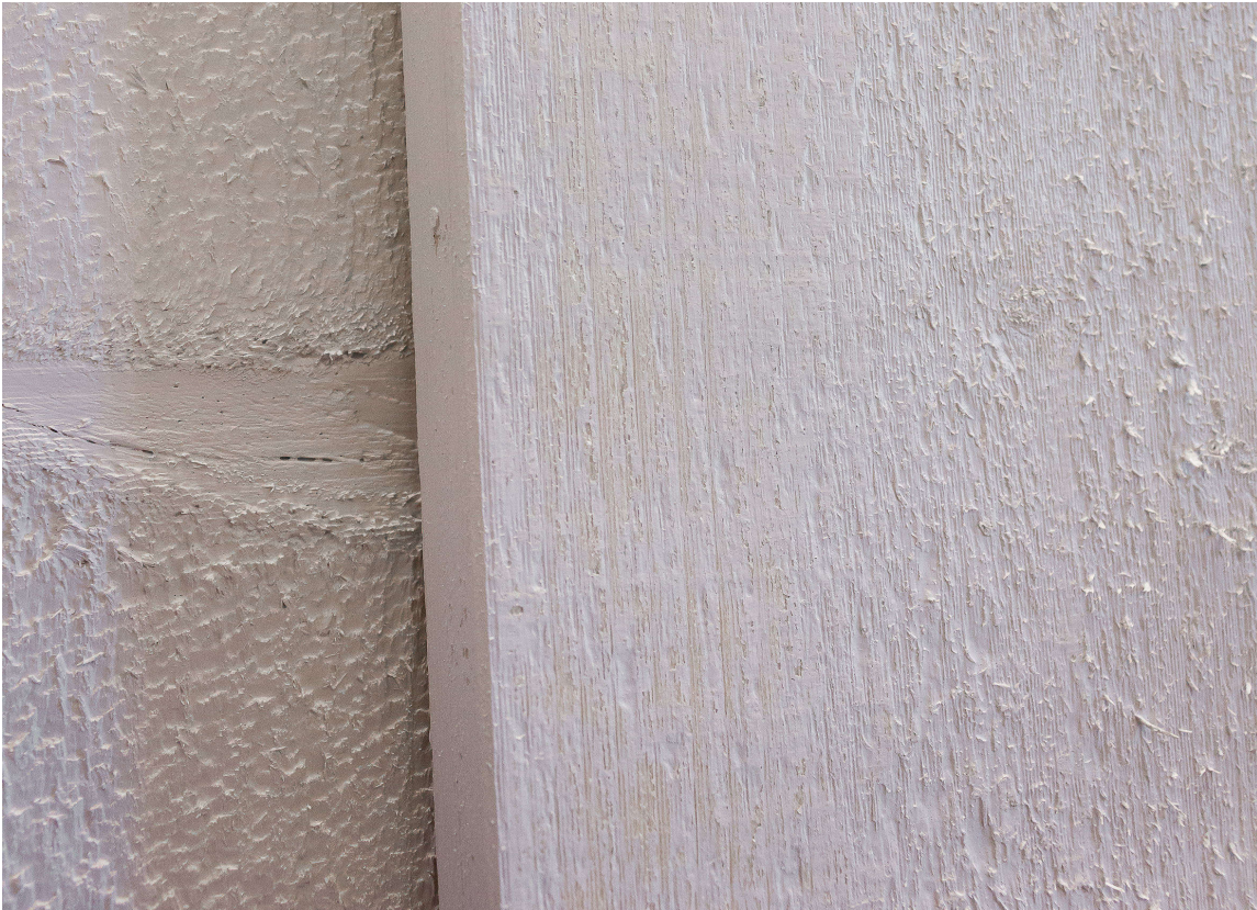
Ny kledning får kraftig fiberreisning etter grunning.