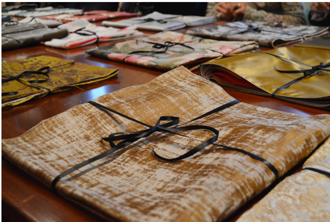
Rubelli tekstiler pent pakket for visning.