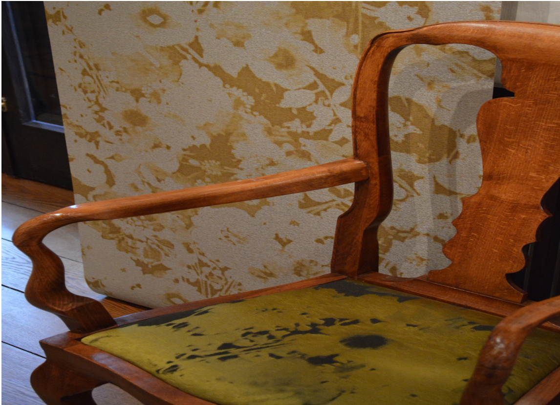
Chiaroscuro fås nå i både tapet og som tekstil.