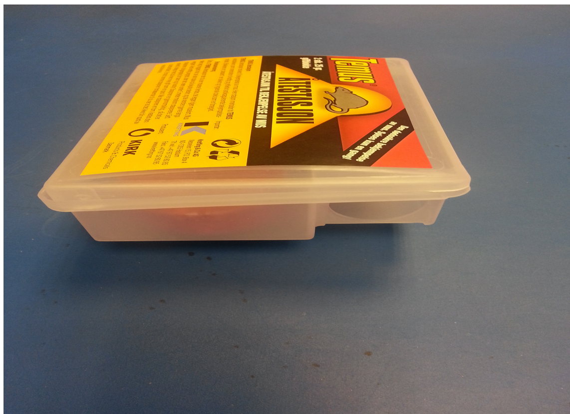
Åtestasjonene har små hull som musene kryper oppi.