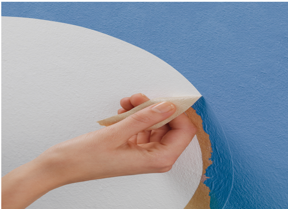
FLEKSIBEL maskeringstape brukes der du vil male buede felter.