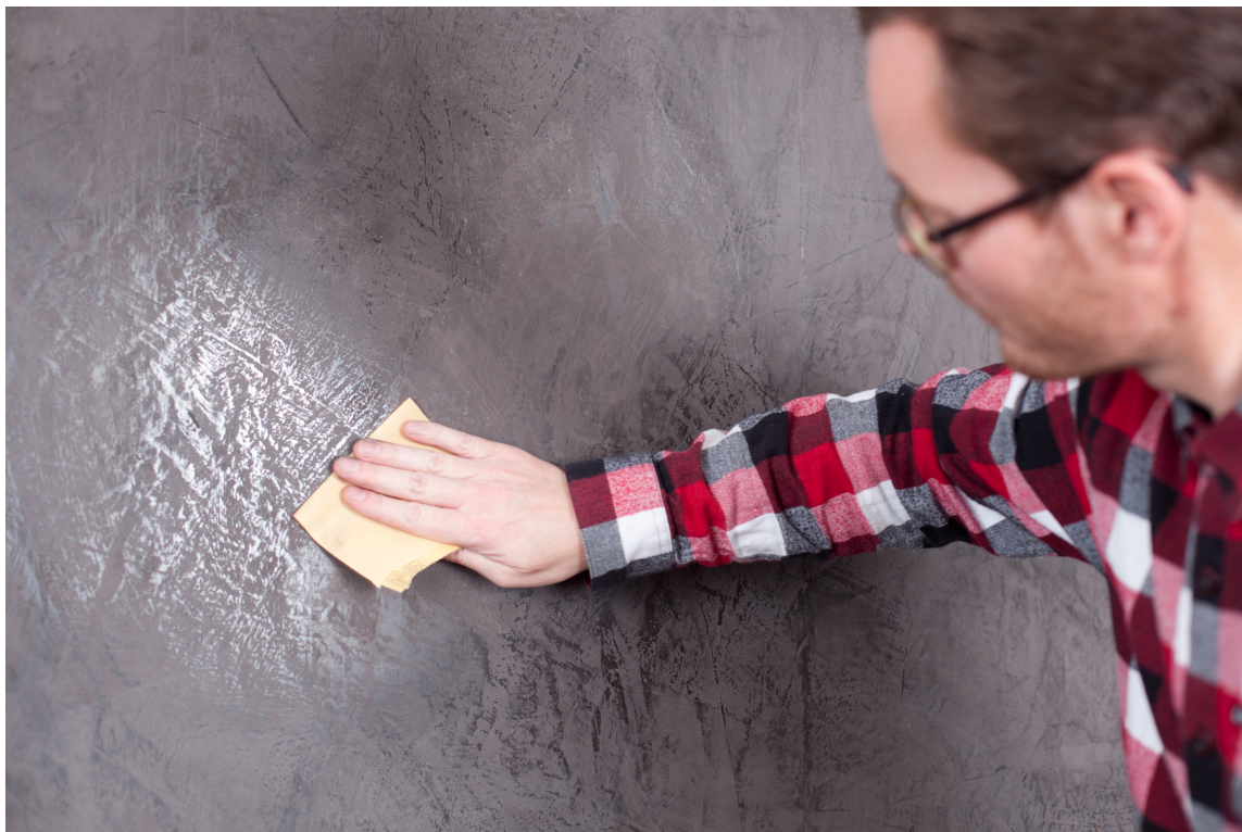
Polér med et fint slipepapir.

og forsiktig frem, og start uten å bruke altfor mye krefter. Du avgjør selv hvor blankt det skal bli etter hvor mye du polerer. Synes du det har blitt for blankt, kan du bare pusse med litt fint slipepapir for å matte ned flaten igjen. Korning 200-300 er egnet til dette.