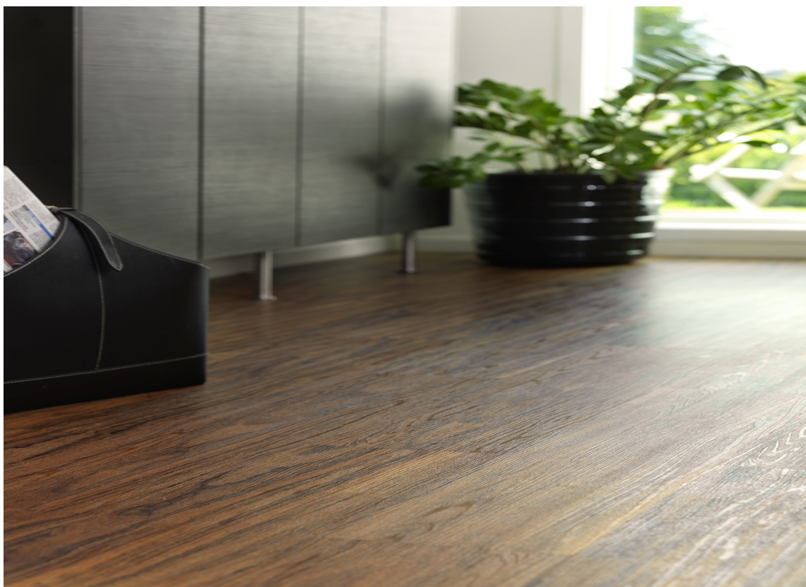
Korklaminat med design som amerikansk valnøtt.