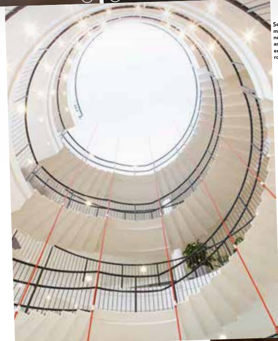
Sett nedenfra får man assosiasjoner til katedralkonstruksjoner med en storliggen romfølelse.

Eni Norge har vært på norsk sokkel i Nordsjøen siden tidlig 1960-tall og kan i år feire femti års virksomhet her i landet. Eni Norge er datterselskap av det italienske oljeselskapet Eni S.p.A. som er engasjert i leting, produksjon, transport, raffinering og markedsføring av olje og gass. Hovedkontoret finner vi, ikke overraskende, på Forus i Stavanger. Det er omkring 3000 oljerelaterte selskaper som har slått seg ned her på Forus – på grensen mellom Stavanger og Sandnes. Blant disse finner vi også selskaper som Statoil, Aibel, GDF Suez og Subsea 7. Sammen representerer selskapene på Forus omkring 20 prosent av verdiskapningen her i landet. Til sammen omsetter de for mer enn 1.000 milliarder kroner. Kontoret er stilrent og gjennomtenkt både utvendig og innvendig og utgjør omkring 13.000 kvadratmeter, fordelt på fem etasjer over bakken, plus en kjelleretasje. Interiørmessig er det lagt vekt på en rekke aspekter.